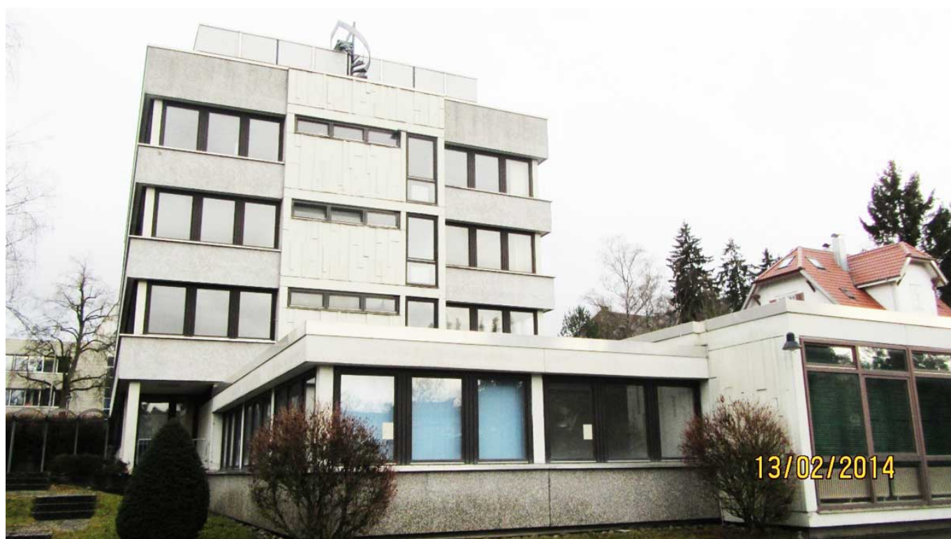
Das Gebäude im Jahr 2016.

Und das hatte auch baurechtliche Gründe, wie Architekt Winfried Stempfle erläutert: Weil an dieser Stelle kein Bebauungsplan besteht, darf nach dem Baugesetzbuch nur gebaut werden, was sich in die Umgebung einfügt. Dort waren zu dieser Zeit aber nur zweistöckige Gebäude, ein so großes durfte also wohl nicht neu gebaut werden. Eine Vorschrift, die nun auch die Bundesagentur betraf.