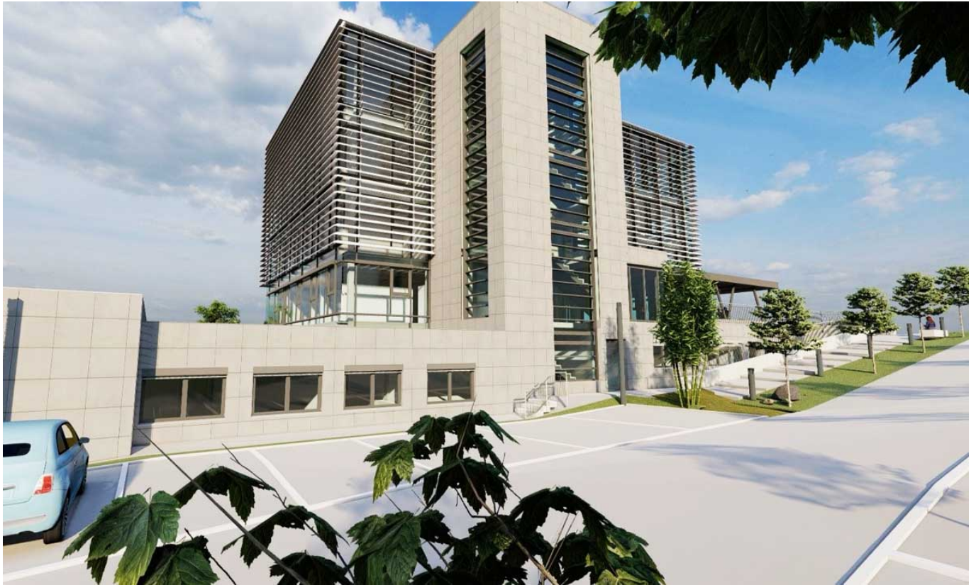
So soll das Haus aussehen, wenn es fertig ist.