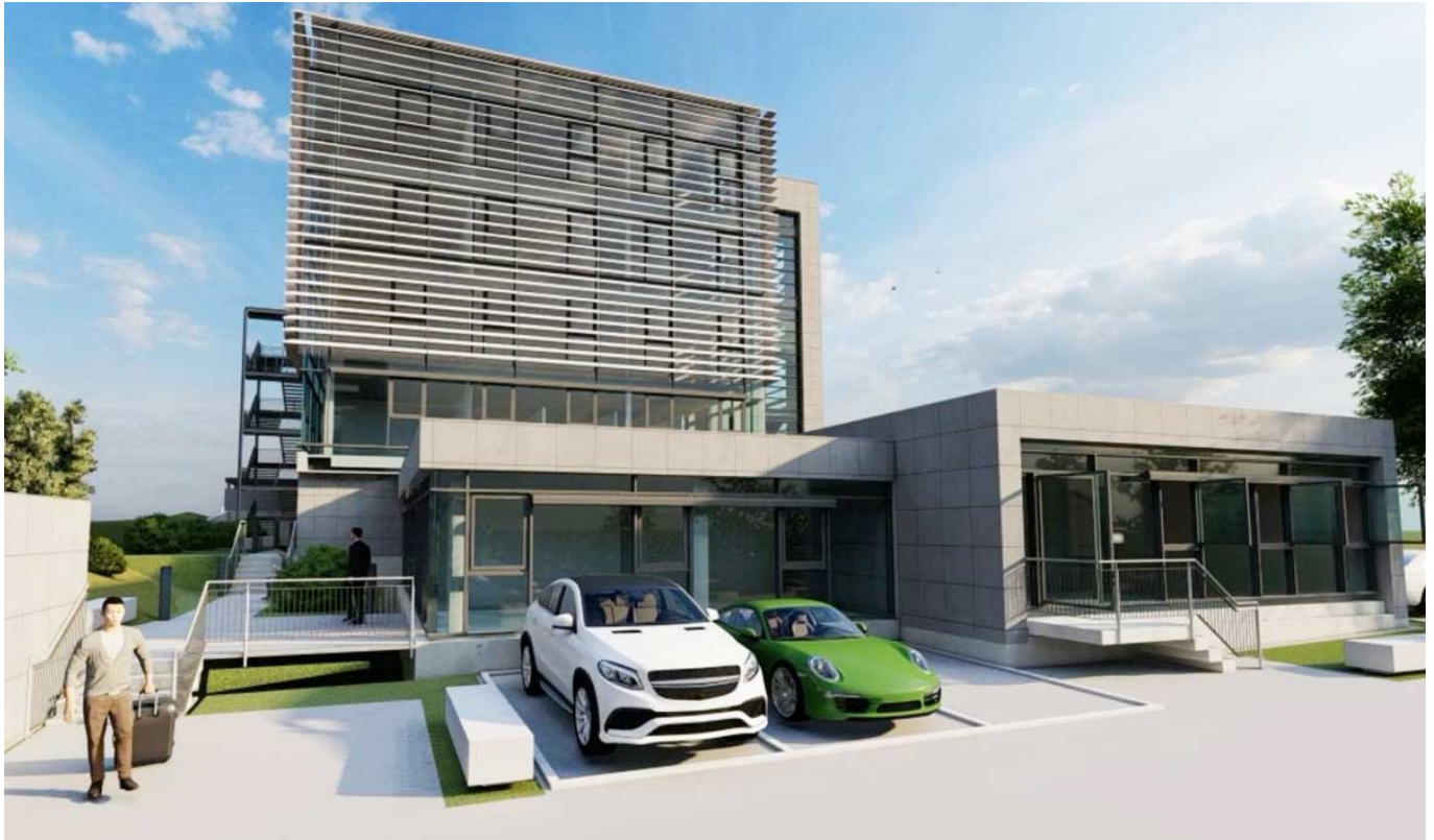
Ansicht von der Marxstraße. Plan: Agentur für Arbeit