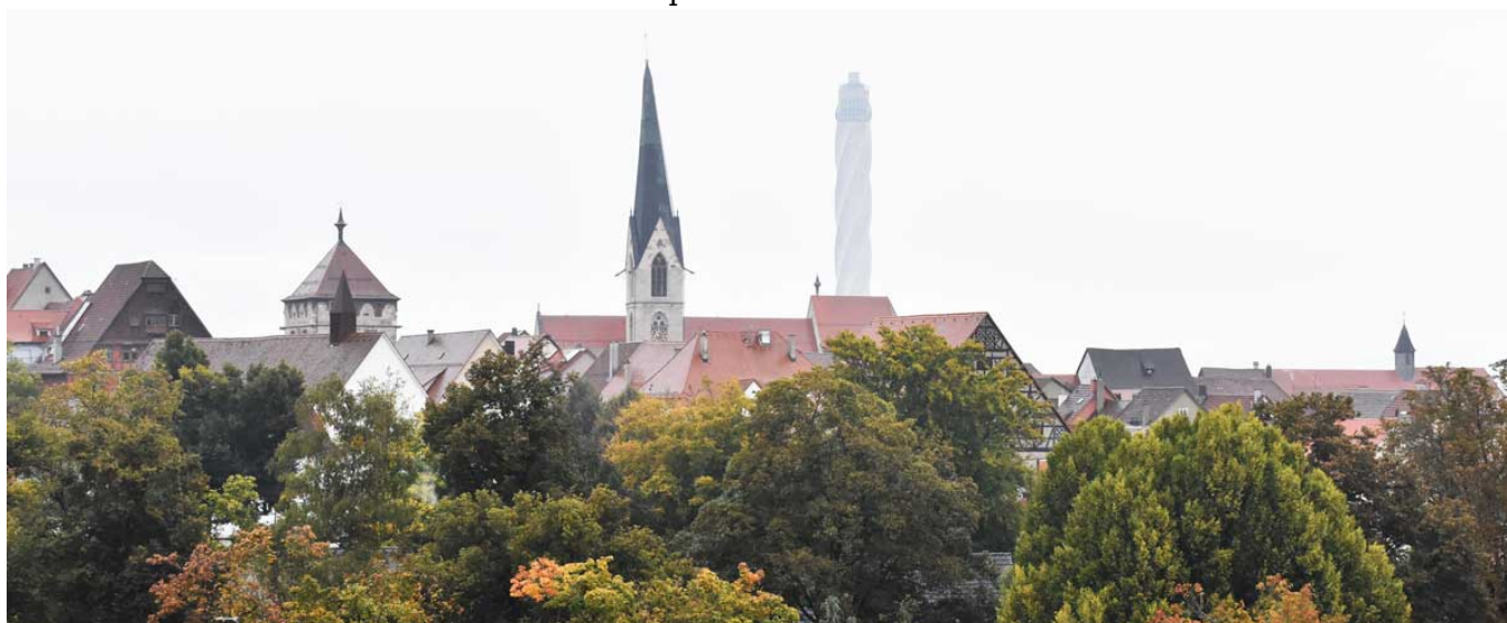
Schöne Aussicht auf die Rottweiler Innenstadt.