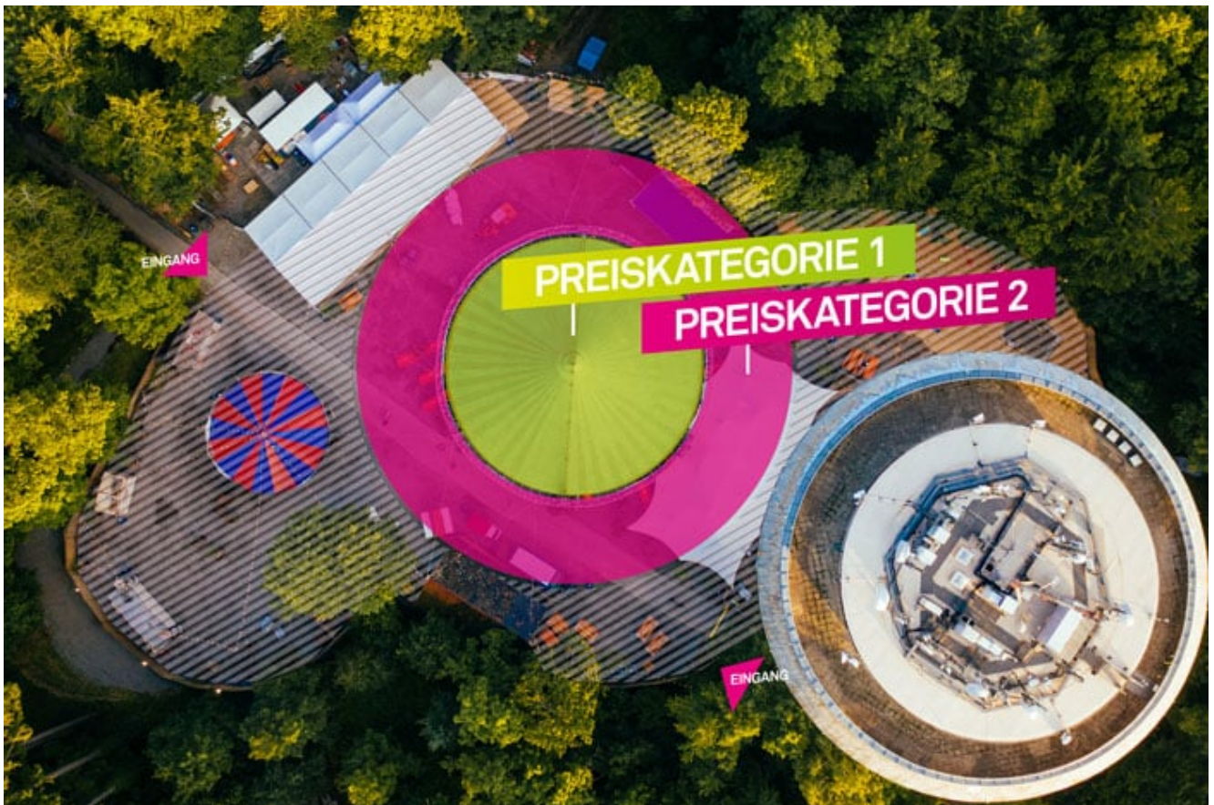
Zwei Preiskategorien an der Bühne am Wasserturm. Grafik: Trendfactory