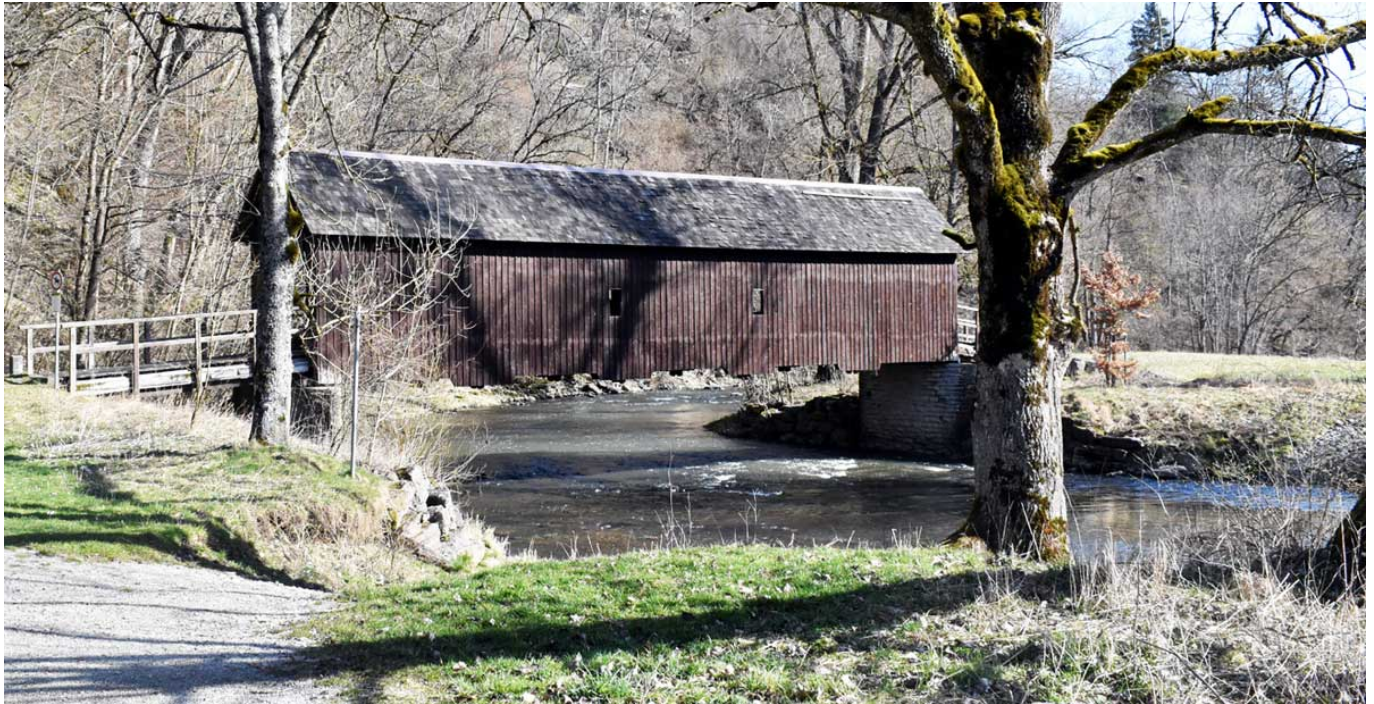
Die Schindelbrücke, wie sie bis April stand. So wird es dort nicht mehr aussehen.

Timo Jesch von der Firma tragwerkeplus stellte die Planung vor. Die tragenden Teile werden aus Stahl konstruiert („Primärkonstruktion“), so dass eine Überdachung nicht notwendig ist und die Brücke wie gefordert 100 Jahre halten kann. Aus Lärchenholz werde dann der Belag erstellt.