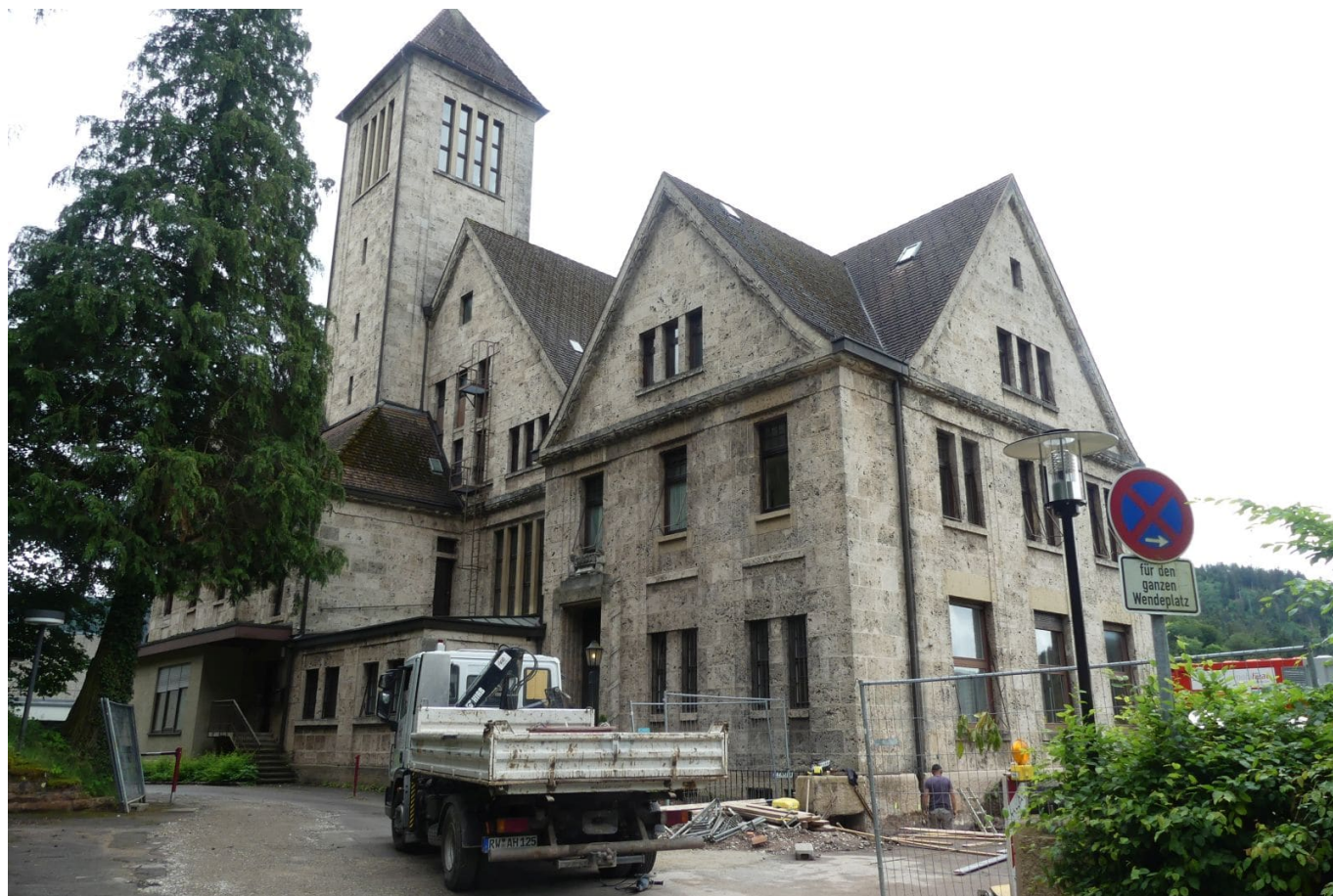
Die Sanierungsarbeiten begannen schon 2018.