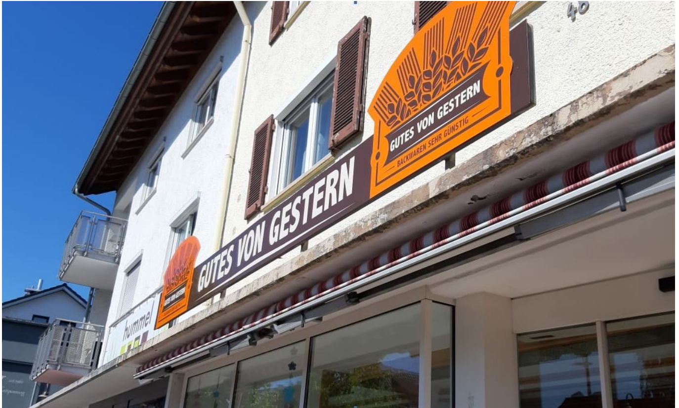
Lobenswert: Das Geschäft in der Sulgauer Straße

Auf dem Plakat steht, wer wegen der aktuellen Lage in Not sei, der bekomme, sein Brot oder was er sonst gerne möchte, geschenkt. Und besonders schön: „Wir verlangen dafür keinen Nachweis, sagen Sie es einfach.“