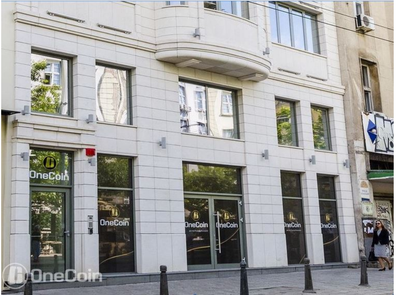
Die OneCoin-Zentrale in Sofia auf einem offiziellen Foto von OneCoin.

Die bulgarische Regierung habe „ihre Pflichten gegenüber den Opfern des bis zu 20 Milliarden US-Dollar umfassenden OneCoin-Pyramidensystems mit Hauptquartier in Sofia zu erfüllen“, so Levy. Bei OneCoin handle es sich um „eine der größten und finanziell erfolgreichsten Finanzpyramiden in der Geschichte“. Die Opfer seien bislang leer ausgegangen, obwohl sich „der allergrößte Teil der Gelder immer noch in den Händen der OneCoin Organisation“ befinde.