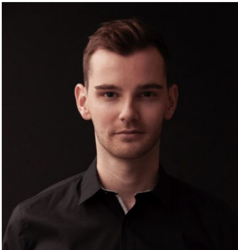
Patrick Rottler.