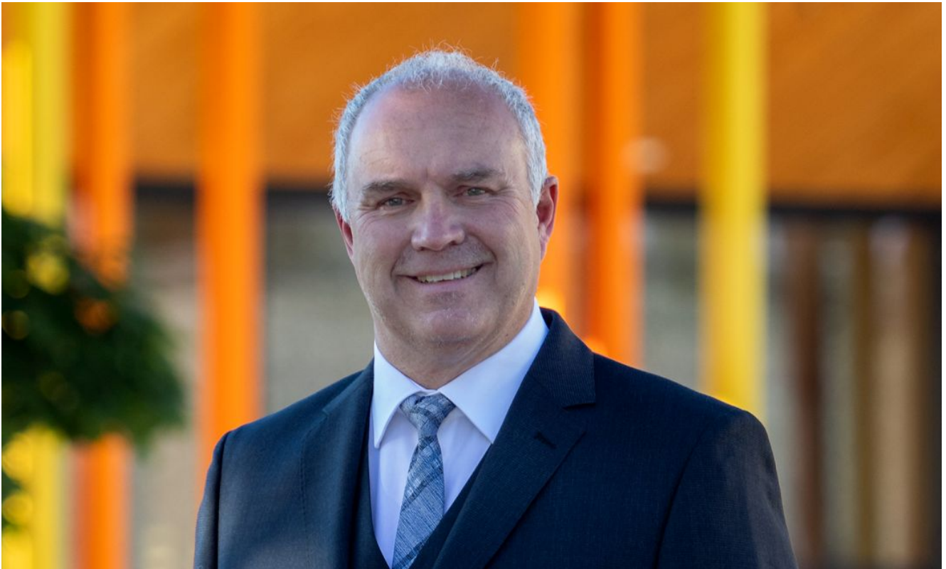
Jürgen Reuter