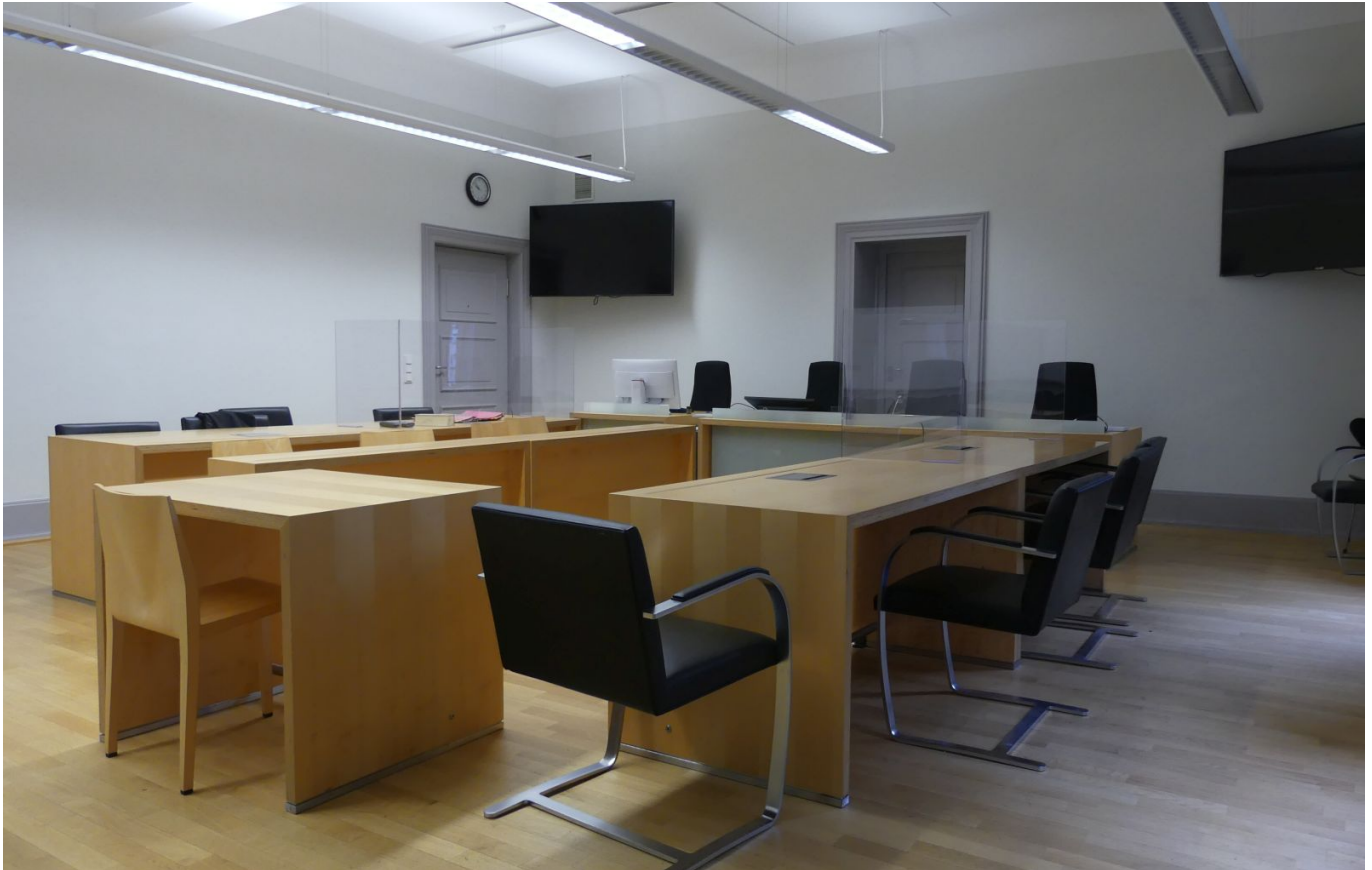
Sitzungssaal 013 mit Coronaschutz.