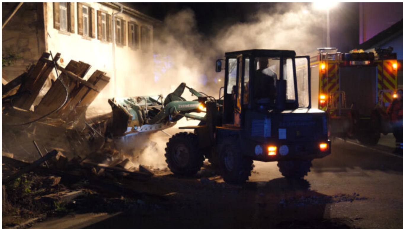
Gebäudeeinsturz in Sulz-Mühlheim.

Die Feuerwehr holte einen Fachberater Statik des THW hinzu. Den Schutt räumten die Feuerwehrleute nach Rücksprache mit ihm und mit der Polizei dann von der Straße, auf die es gerutscht war.